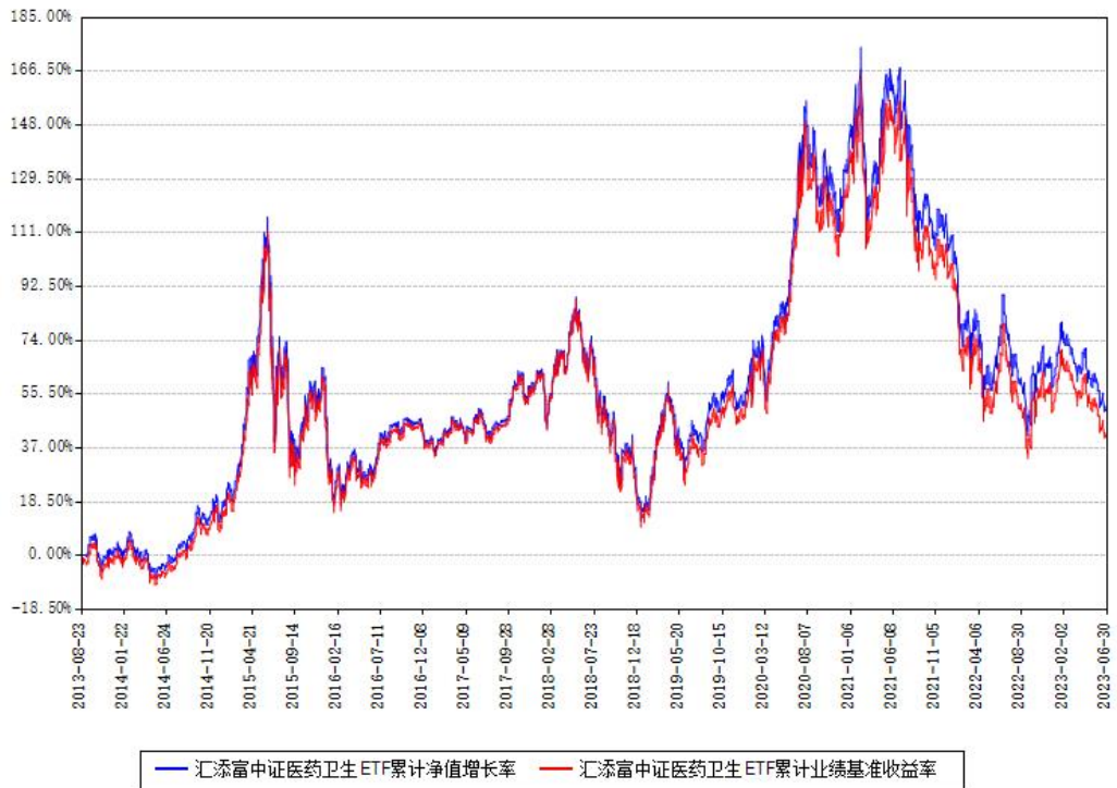
汇添富中证医药卫生ETF累计净值增长率与同期业绩基准收益率对比图

(二) 自基金合同生效以来基金累计净值增长率变动及其与同期业绩比较基准收益率变动的比较图