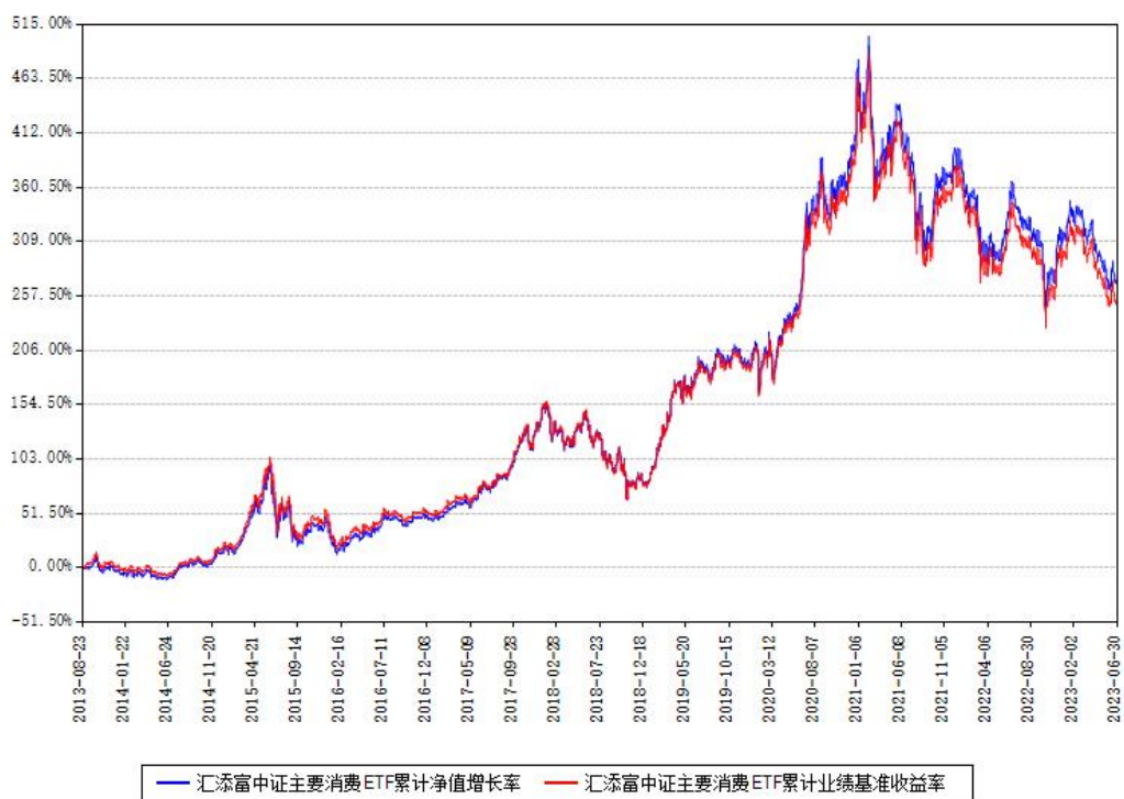
汇添富中证主要消费ETF累计净值增长率与同期业绩基准收益率对比图