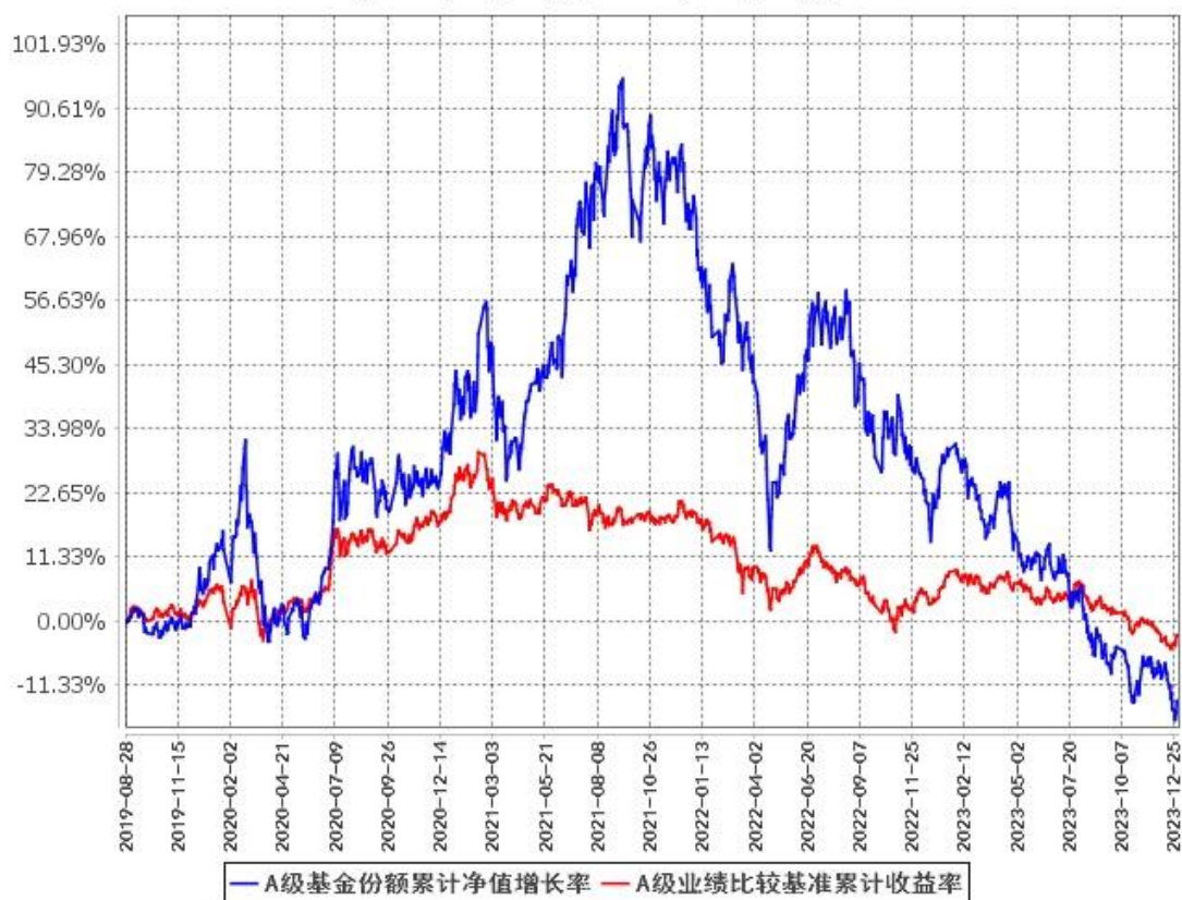
A级基金份额累计净值增长率与同期业绩比较基准收益率的历史走势对比图 (2019年8月28日至2023年12月31日)