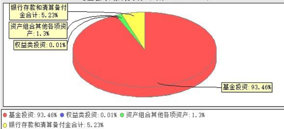
华宝中证科技龙头交易型开放式指数证券投资基金发起式联接基金投资组合资产配置图表(数据截止日期: 20240930)