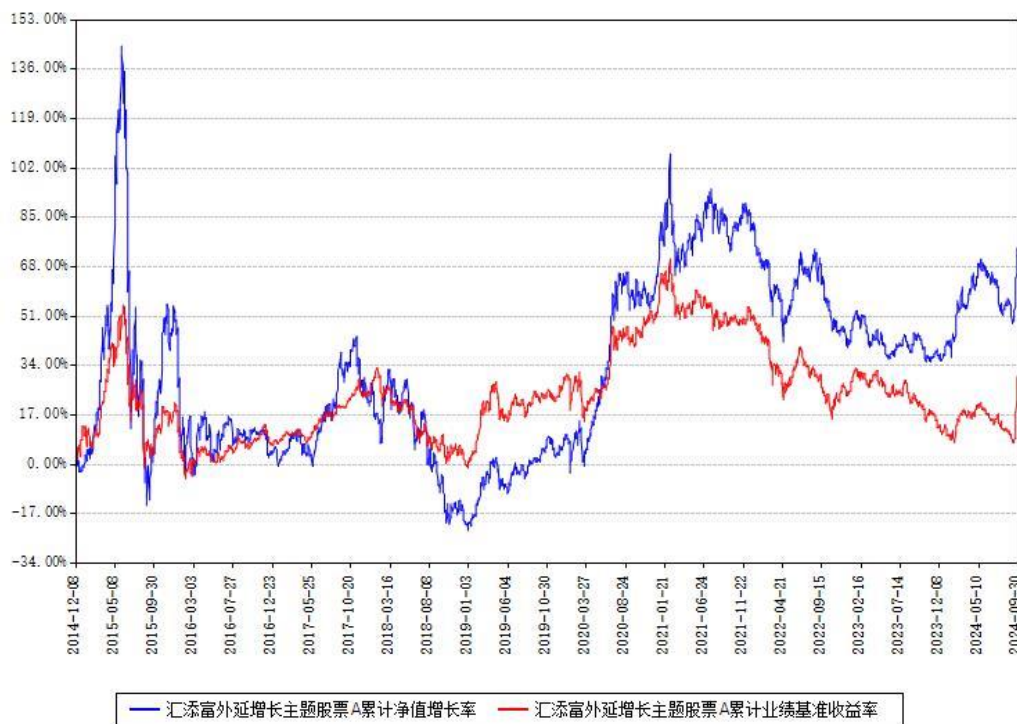
汇添富外延增长主题股票A累计净值增长率与同期业绩基准收益率对比图

(二)自基金合同生效以来基金累计净值增长率变动及其与同期业绩比较基准收益率变动的比较