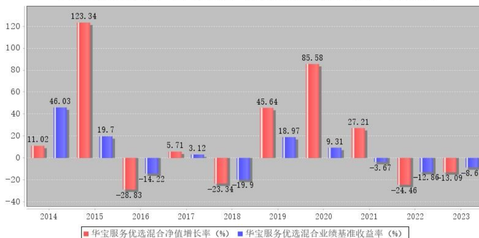
华宝服务优选混合每年净值增长率与同期业绩比较基准收益率的对比图