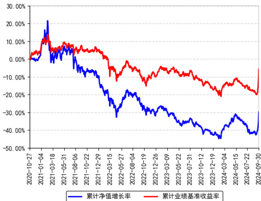
南方行业精选一年持有混合A累计净值增长率与同期业绩比较基准收益率的历史走势对比图