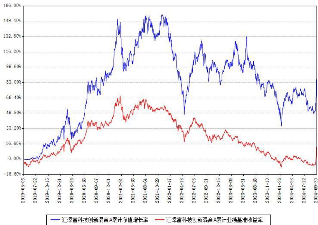
汇添富科技创新混合A累计净值增长率与同期业绩基准收益率对比图