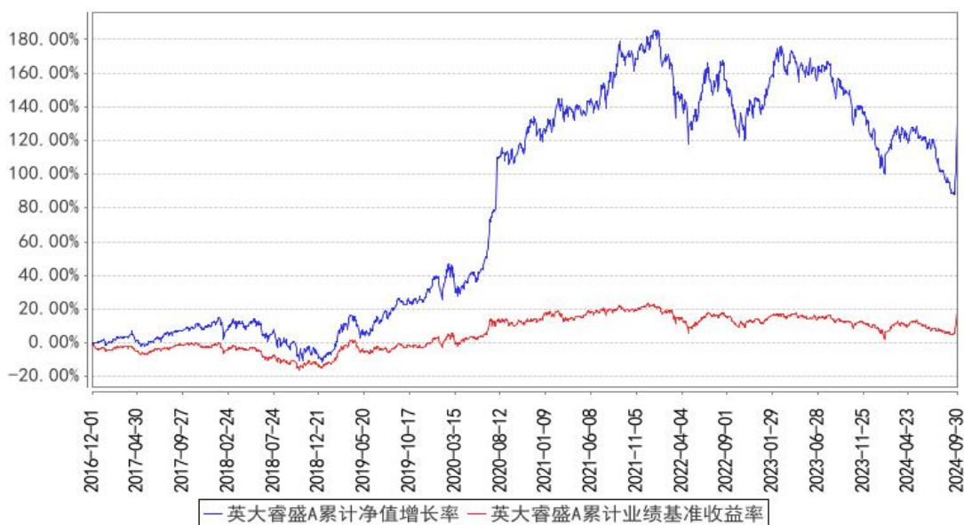
英大睿盛A累计净值增长率与同期业绩比较基准收益率的历史走势对比图