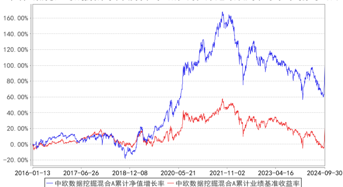
中欧数据挖掘混合A累计净值增长率与同期业绩比较基准收益率的历史走势对比图

注：“2019年4月26日组合业绩比较基准变更为中证500指数收益率*95%+中债综合指数收益率*5%。