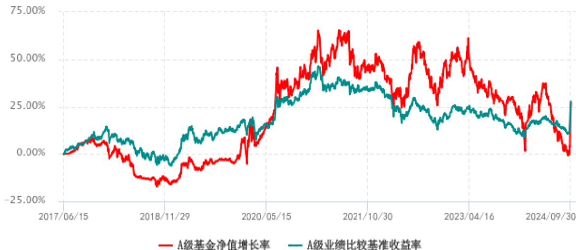
A 级基金份额累计净值增长率与同期业绩比较基准收益率历史走势对比图 (2017年06月15日-2024年09月30日)