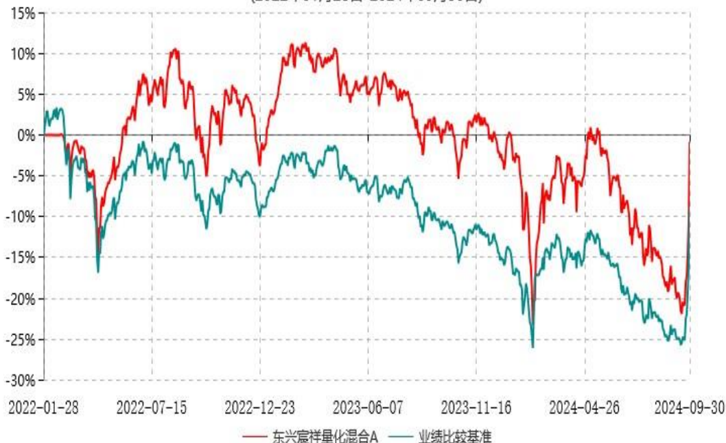
东兴宸祥量化混合C累计净值增长率与业绩比较基准收益率历史走势对比图