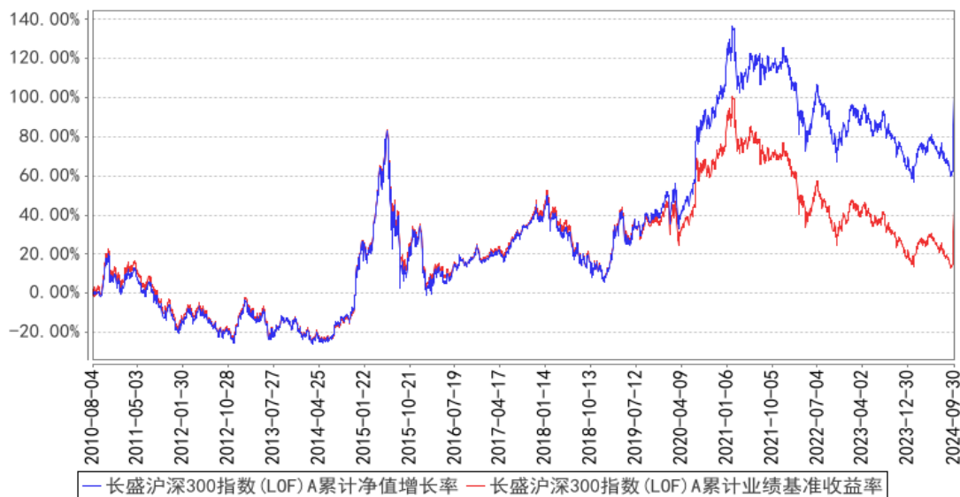
长盛沪深300指数(LOF)A累计净值增长率与同期业绩比较基准收益率的历史走势对比图