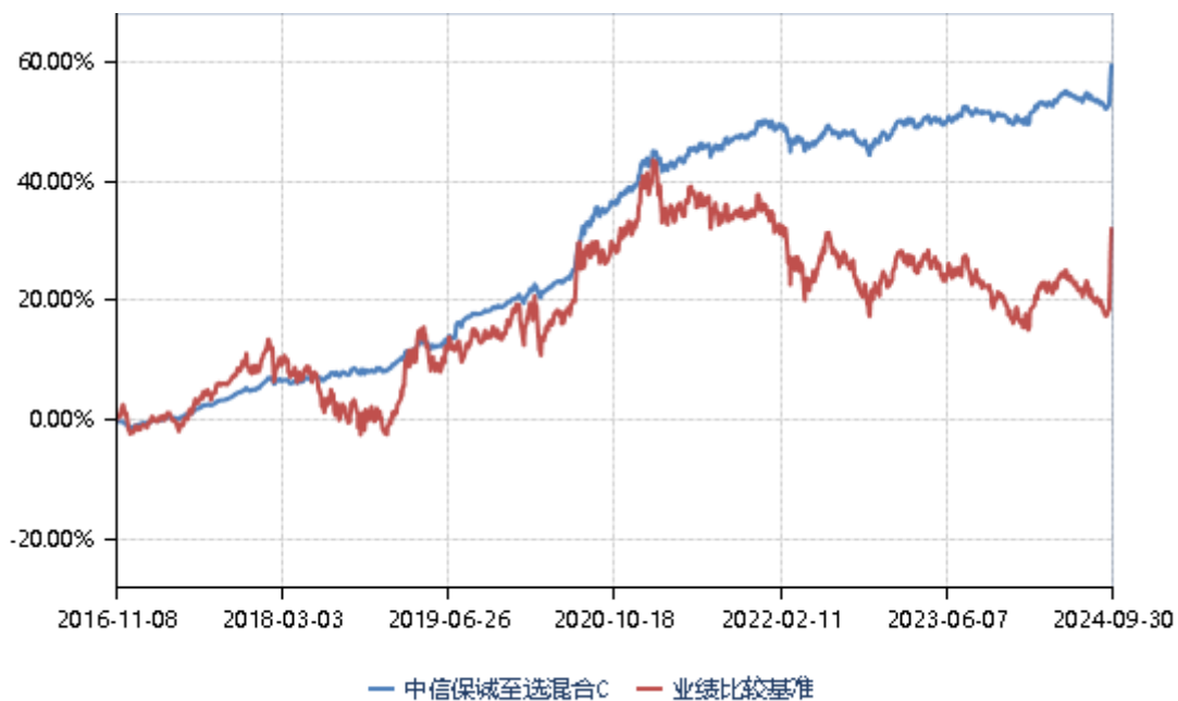
中信保诚至选混合 E