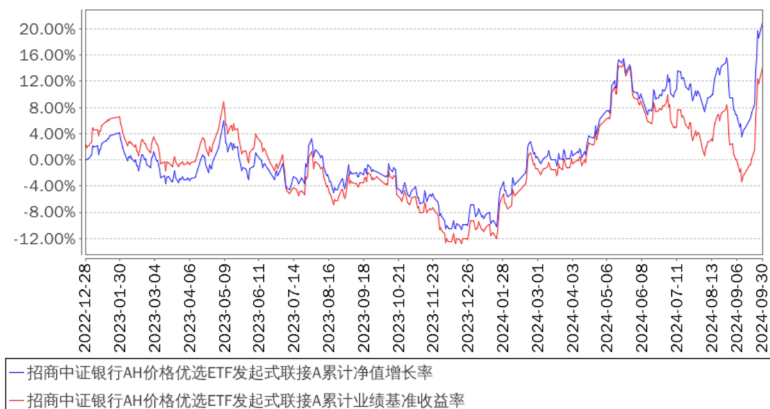
招商中证银行AH价格优选ETF发起式联接A累计净值增长率与同期业绩比较基准收益率的历史走势对比图