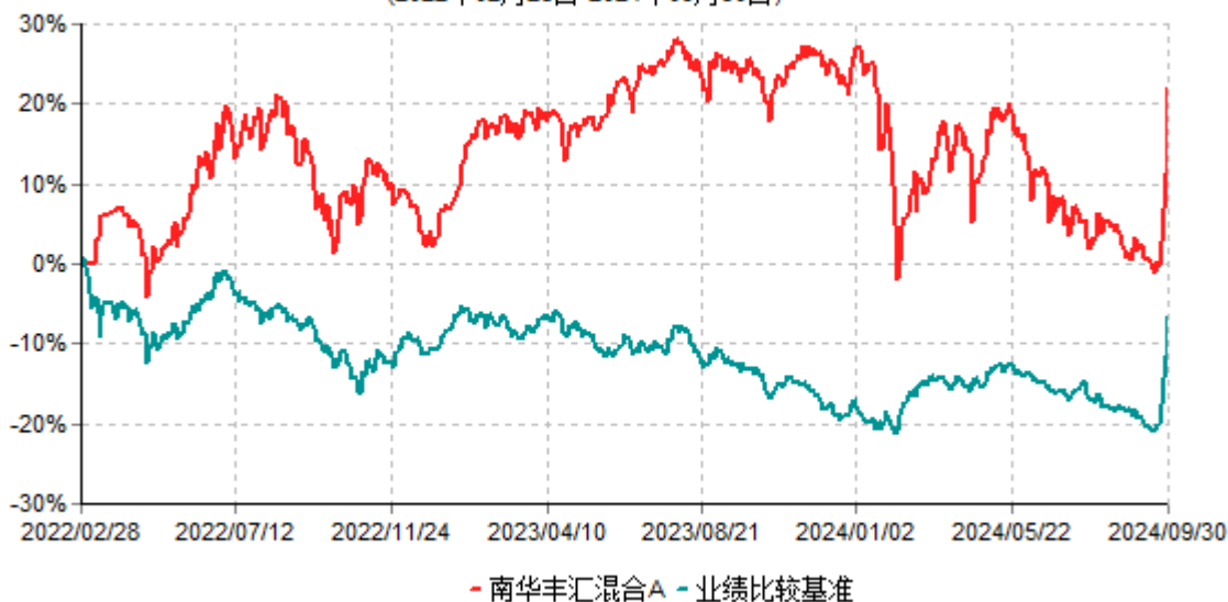
南华丰汇混合A累计净值增长率与业绩比较基准收益率历史走势对比图 (2022年02月28日-2024年09月30日)