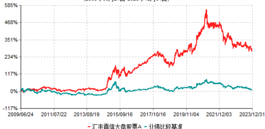
汇丰晋信大盘股票A累计净值增长率与业绩比较基准收益率历史走势对比图 (2009年06月24日-2023年12月31日)

注：1. 按照基金合同的约定，本基金的股票投资比例范围为基金资产的 85%-95%，其中，本基金将不低于 80% 的股票资产投资于国内 A 股市场上具有盈利持续稳定增长、价值