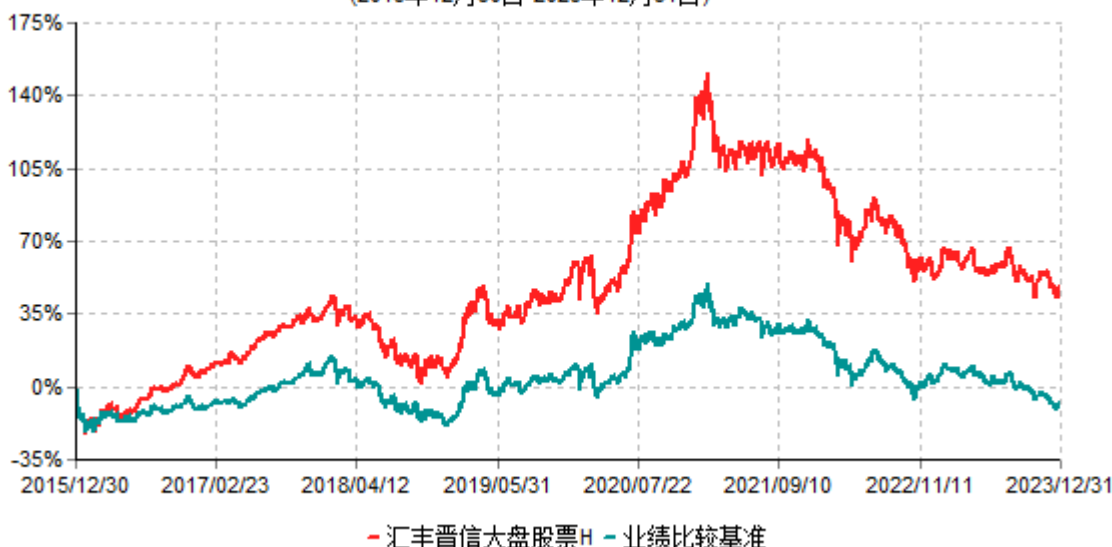
汇丰晋信大盘股票H累计净值增长率与业绩比较基准收益率历史走势对比图 (2015年12月30日-2023年12月31日)

注：1. 按照基金合同的约定，本基金的股票投资比例范围为基金资产的 85%-95%，其中，本基金将不低于 80%的股票资产投资于国内 A 股市场上具有盈利持续稳定增长、价值低估、且在各行各业中具有领先地位的大盘蓝筹股票。本基金固定收益类证券和现金投资比例范围为基金资产的 5%-15%，其中现金（不包括结算备付金、存出保证金、应收申购款等）或到期日在一年以内的政府债券的投资比例不低于基金资产净值的 5%。