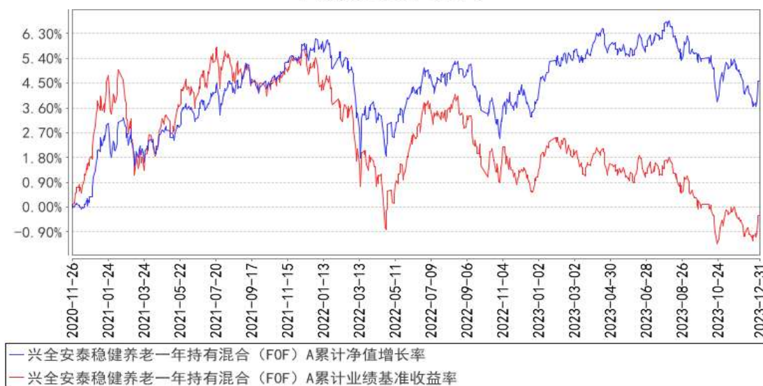
兴全安泰稳健养老一年持有混合（FOF）A 累计净值增长率与同期业绩比较基准收益率的历史走势对比图