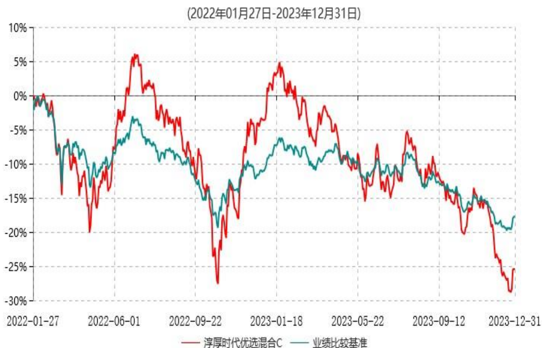
淳厚时代优选混合C累计净值增长率与业绩比较基准收益率历史走势对比图

注：本基金基金合同生效日为 2022 年 1 月 27 日。按基金合同规定，本基金自基金合同生效起 6 个月内为建仓期。建仓期结束时本基金的各项投资比例均符合基金合同约定。