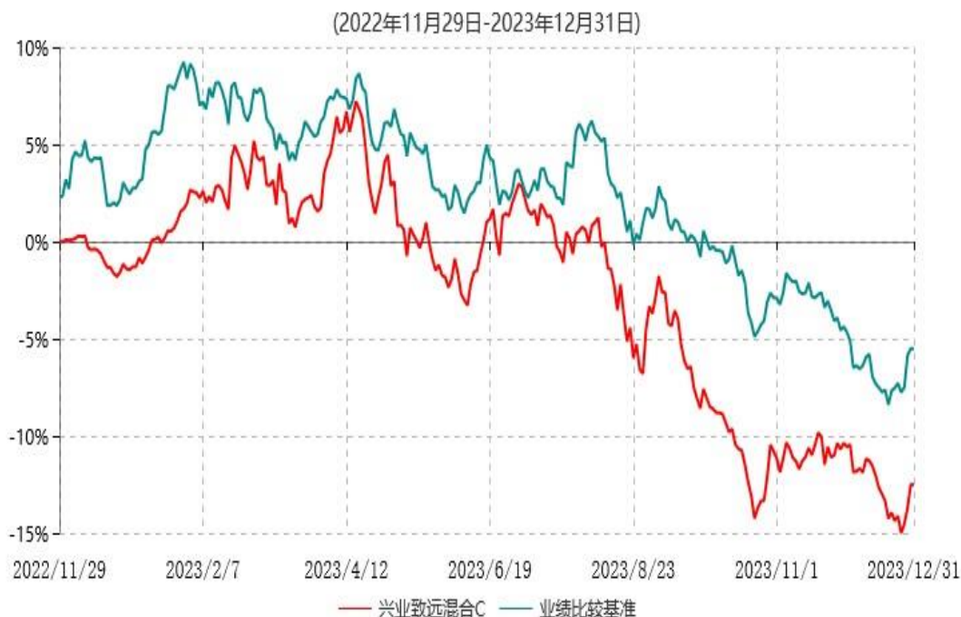
兴业致远混合C累计净值增长率与业绩比较基准收益率历史走势对比图

注：本基金基金合同于 2022 年 11 月 29 日生效，根据本基金基金合同规定，本基金自基金合同生效之日起六个月内已使基金的投资组合比例符合基金合同的约定。