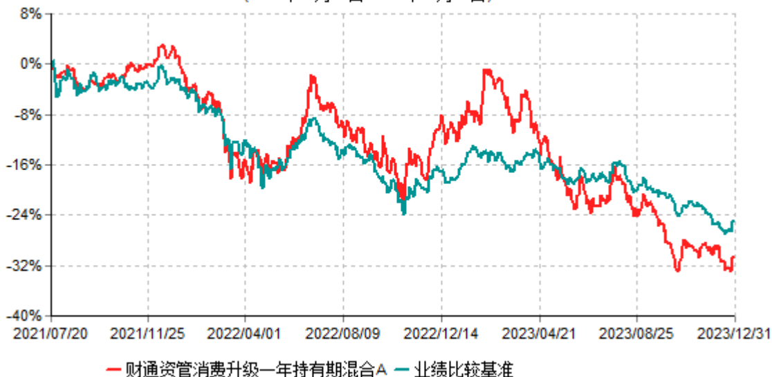
财通资管消费升级一年持有期混合A累计净值增长率与业绩比较基准收益率历史走势对比图 (2021年07月20日-2023年12月31日)