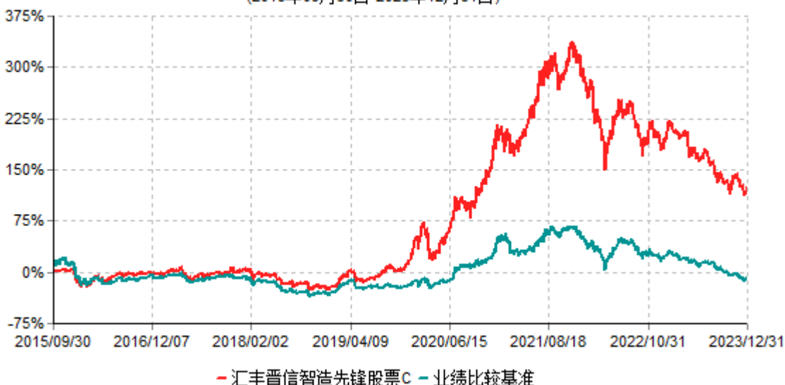
汇丰晋信智造先锋股票C累计净值增长率与业绩比较基准收益率历史走势对比图 (2015年09月30日-2023年12月31日)