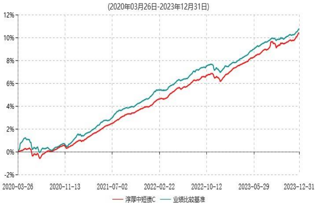
淳厚中短债C累计净值增长率与业绩比较基准收益率历史走势对比图

注：本基金基金合同生效日为 2020 年 3 月 26 日。按基金合同约定，本基金自基金合同生效起 6 个月内为建仓期。建仓期结束时本基金的各项投资比例均符合基金合同约定。