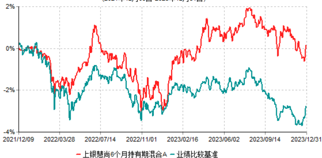
上银慧尚6个月持有期混合A累计净值增长率与业绩比较基准收益率历史走势对比图 (2021年12月09日-2023年12月31日)