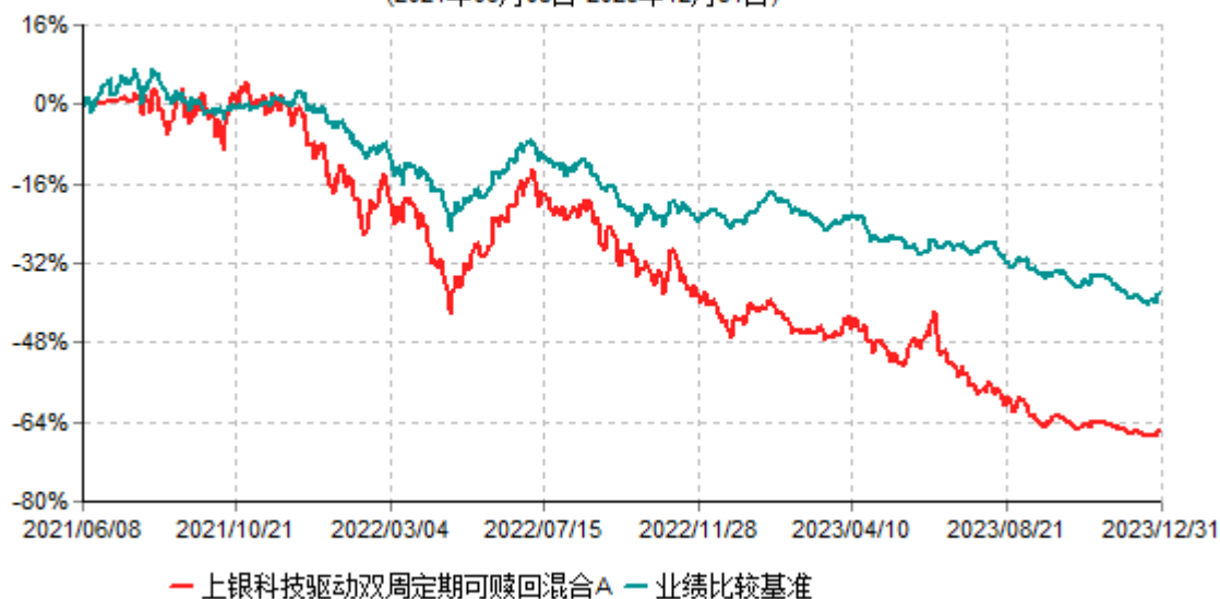
上银科技驱动双周期可赎回混合A累计净值增长率与业绩比较基准收益率历史走势对比图 (2021年06月08日-2023年12月31日)