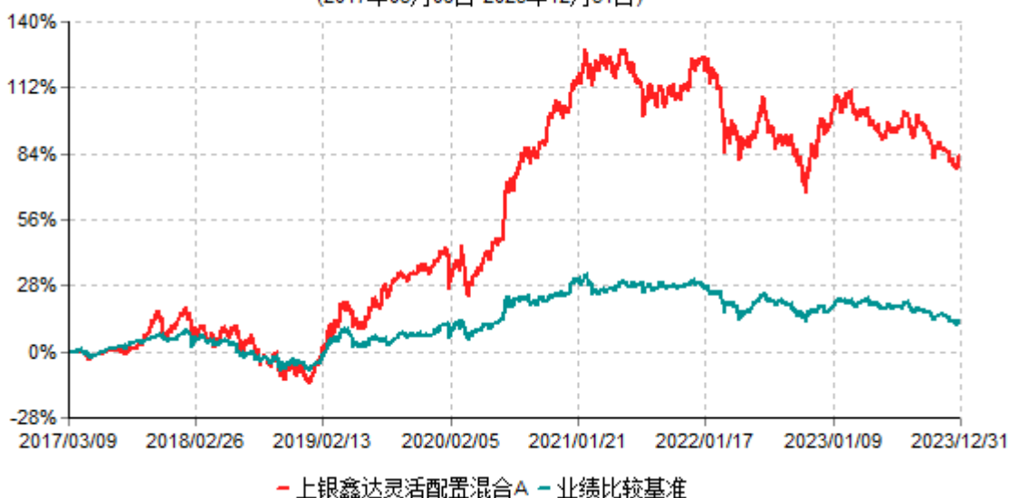
上银鑫达灵活配置混合A累计净值增长率与业绩比较基准收益率历史走势对比图 (2017年03月09日-2023年12月31日)