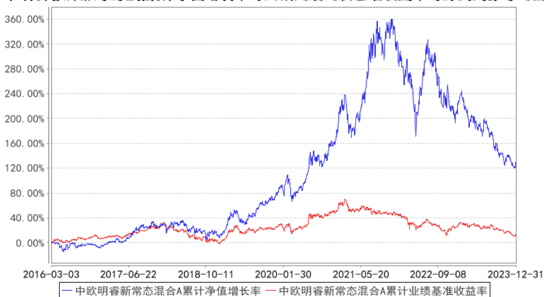
中欧明睿新常态混合A累计净值增长率与同期业绩比较基准收益率的历史走势对比图

注：2021年9月8日起组合业绩比较基准变更为沪深300指数收益率*60%+中证港股通综合指数(人民币)收益率*20%+中债综合指数收益率*20%。