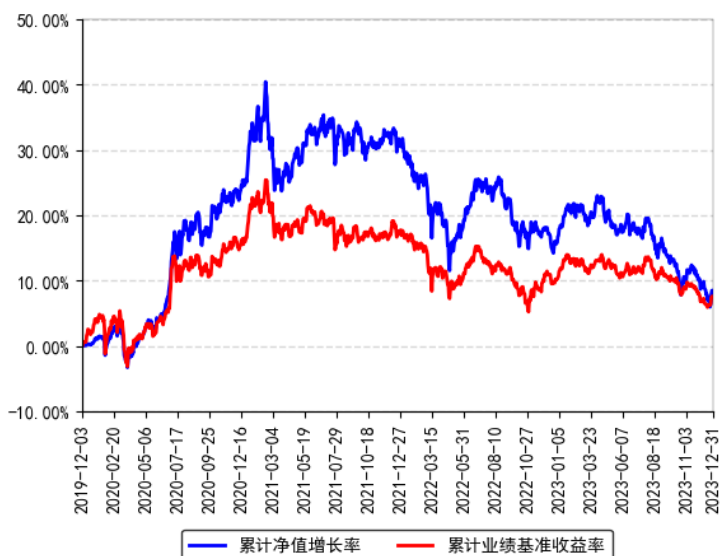
南方养老目标日期2030三年持有混合发起（FOF）A累计净值增长率与同期业绩比较基准收益率的历史走势对比图