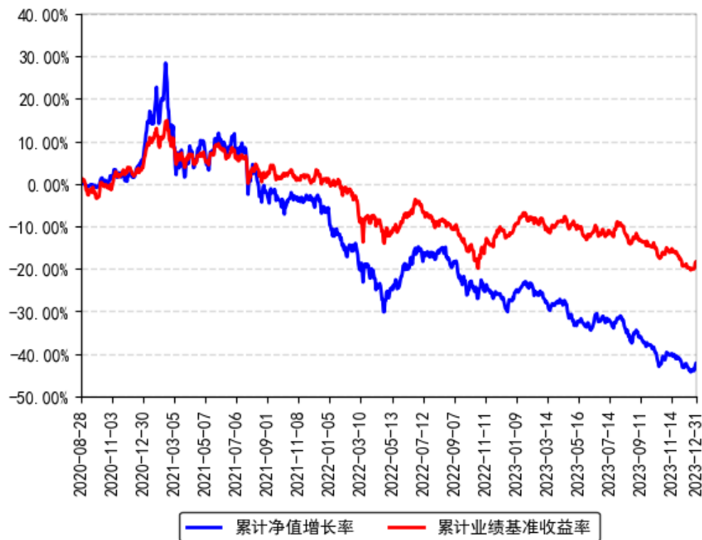
南方创新驱动混合A累计净值增长率与同期业绩比较基准收益率的历史走势对比图