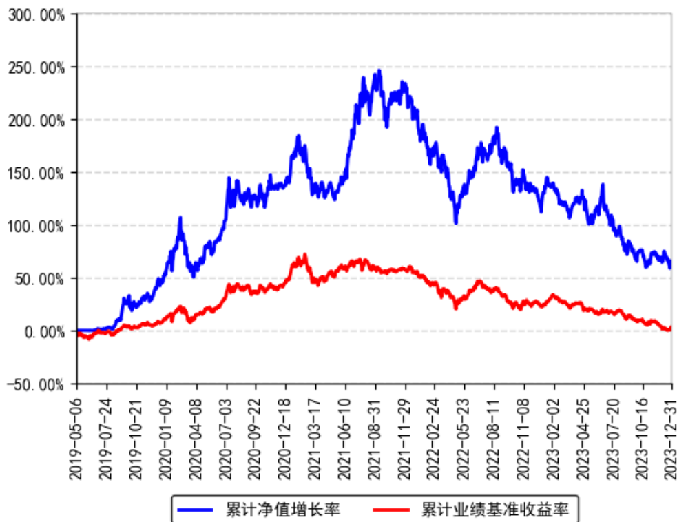
南方科技创新混合A累计净值增长率与同期业绩比较基准收益率的历史走势对比图