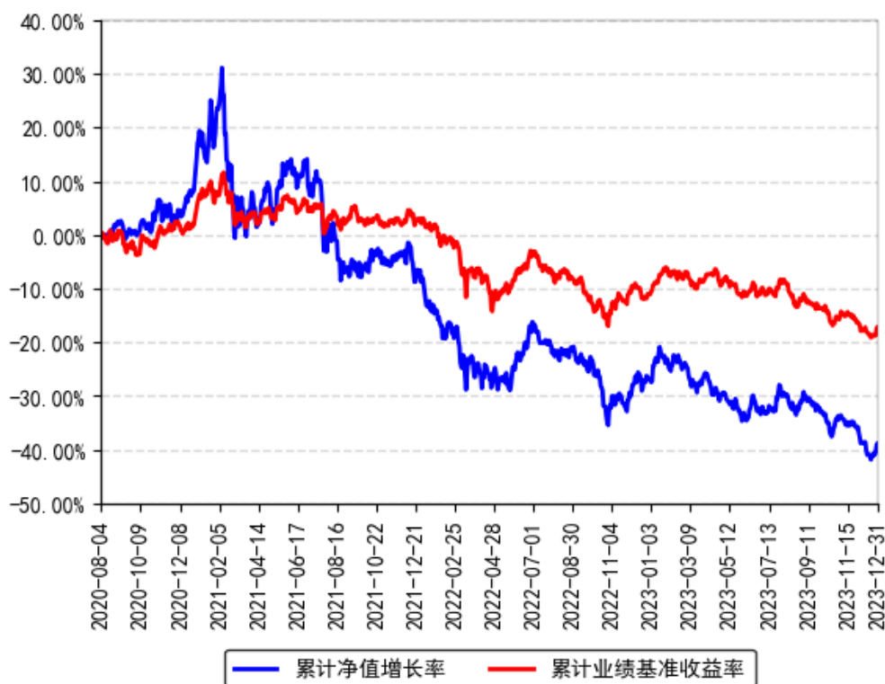
南方景气驱动混合A累计净值增长率与同期业绩比较基准收益率的历史走势对比图