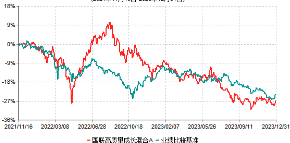
国联高质量成长混合A累计净值增长率与业绩比较基准收益率历史走势对比图 (2021年11月16日-2023年12月31日)