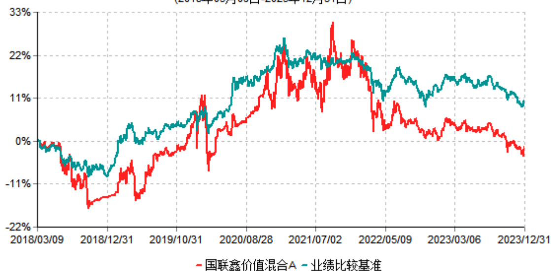
国联鑫价值混合A累计净值增长率与业绩比较基准收益率历史走势对比图 (2018年03月09日-2023年12月31日)