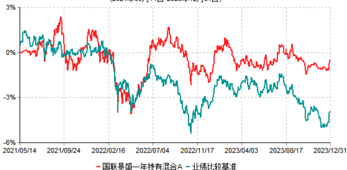
国联景盛一年持有混合A累计净值增长率与业绩比较基准收益率历史走势对比图 (2021年05月14日-2023年12月31日)