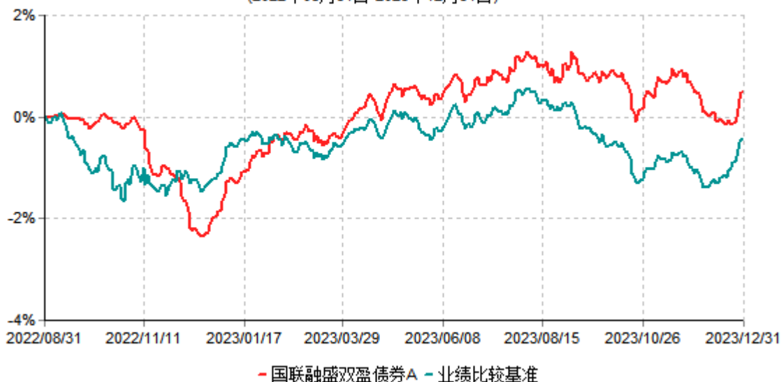
国联融盛双盈债券A累计净值增长率与业绩比较基准收益率历史走势对比图 (2022年08月31日-2023年12月31日)