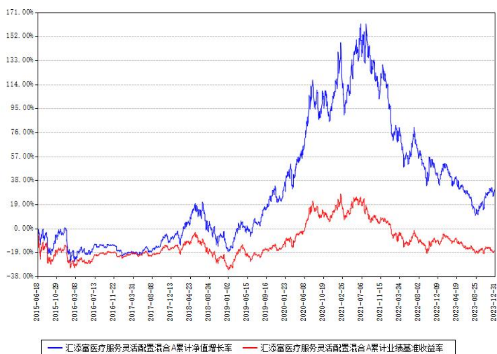
汇添富医疗服务灵活配置混合A累计净值增长率与同期业绩基准收益率对比图