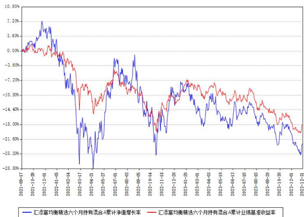
汇添富均衡精选六个月持有混合A累计净值增长率与同期业绩比较基准收益率对比图