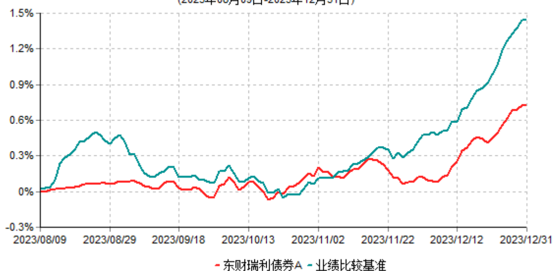
东财瑞利债券A累计净值增长率与业绩比较基准收益率历史走势对比图 (2023年08月09日-2023年12月31日)