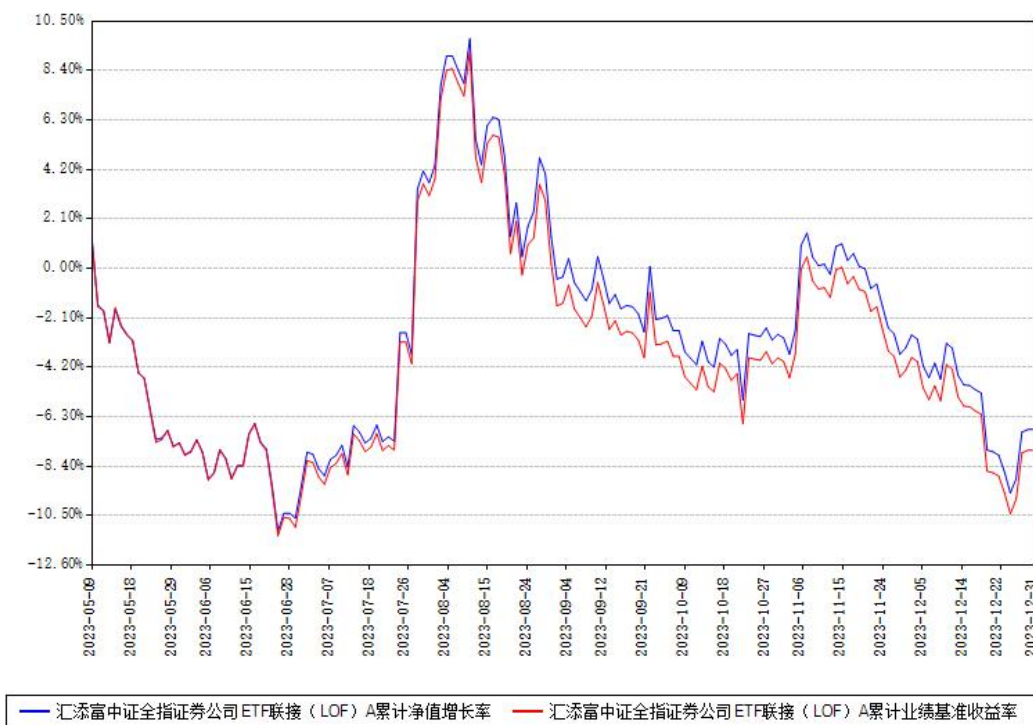
汇添富中证全指证券公司ETF联接（LOF）A累计净值增长率与同期业绩基准收益率对比图