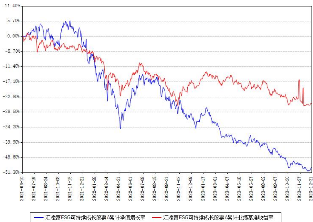
汇添富 ESG 可持续成长股票 C 累计净值增长率与同期业绩基准收益率对比图