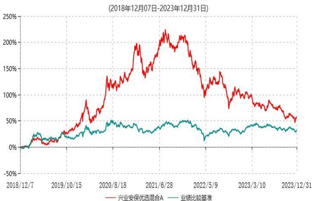
兴业安保优选混合A累计净值增长率与业绩比较基准收益率历史走势对比图