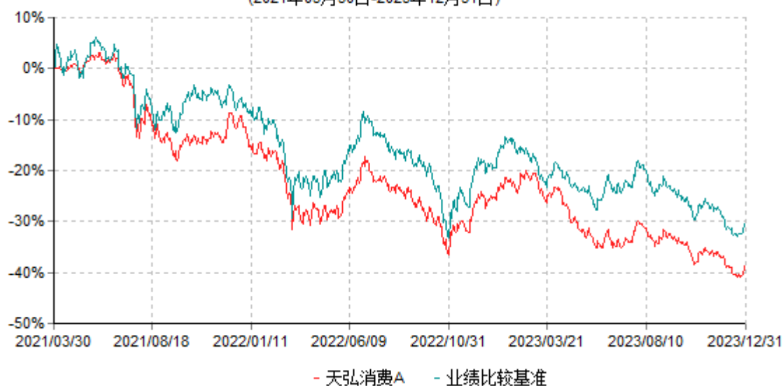
天弘消费A累计净值增长率与业绩比较基准收益率历史走势对比图 (2021年03月30日-2023年12月31日)