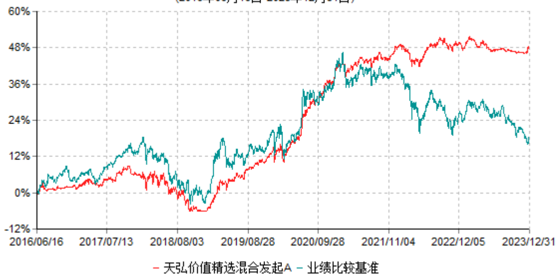
天弘价值精选混合发起A累计净值增长率与业绩比较基准收益率历史走势对比图 (2016年06月16日-2023年12月31日)