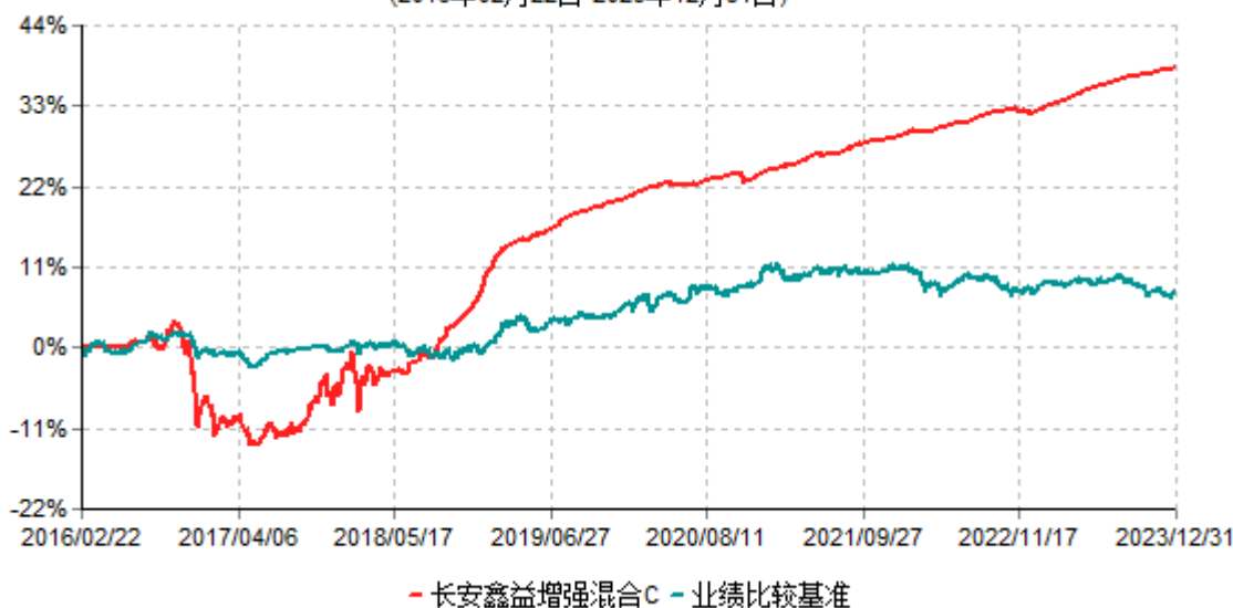
长安鑫益增强混合C累计净值增长率与业绩比较基准收益率历史走势对比图 (2016年02月22日-2023年12月31日)

根据基金合同的规定,自基金合同生效之日起 6 个月内基金各项资产配置比例需符合基金合同要求。本基金在建仓期结束后,各项资产配置比例已符合基金合同有关投资比例的约定。基金合同生效日至报告期末,本基金运作时间超过一年。图示日期为 2016 年 2 月 22 日至 2023 年 12 月 31 日。