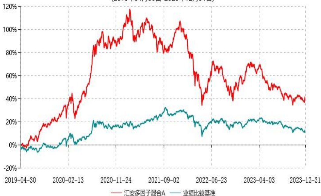
汇安多因子混合C累计净值增长率与业绩比较基准收益率历史走势对比图