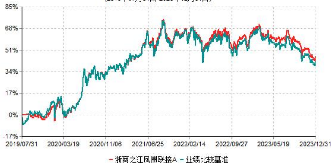
浙商之江凤凰联接A累计净值增长率与业绩比较基准收益率历史走势对比图 (2019年07月31日-2023年12月31日)