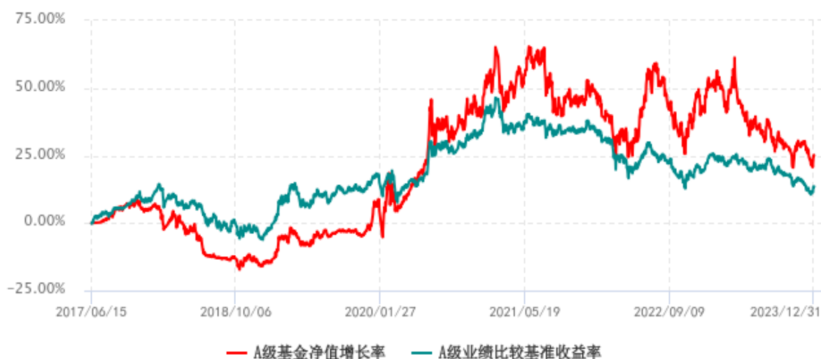
A 级基金份额累计净值增长率与同期业绩比较基准收益率历史走势对比图 (2017年06月15日-2023年12月31日)