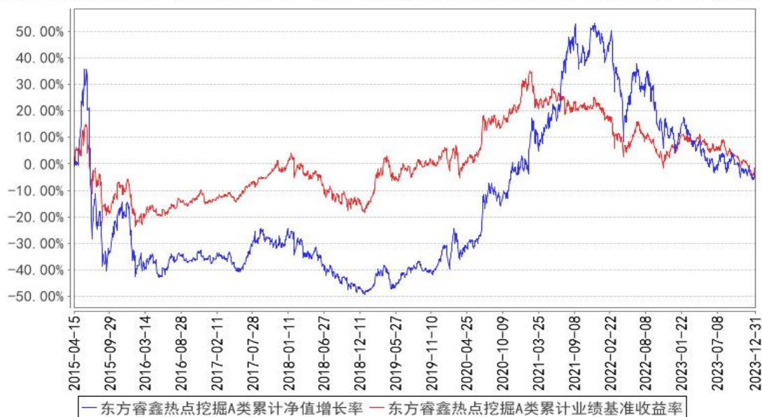
东方睿鑫热点挖掘A类累计净值增长率与同期业绩比较基准收益率的历史走势对比图