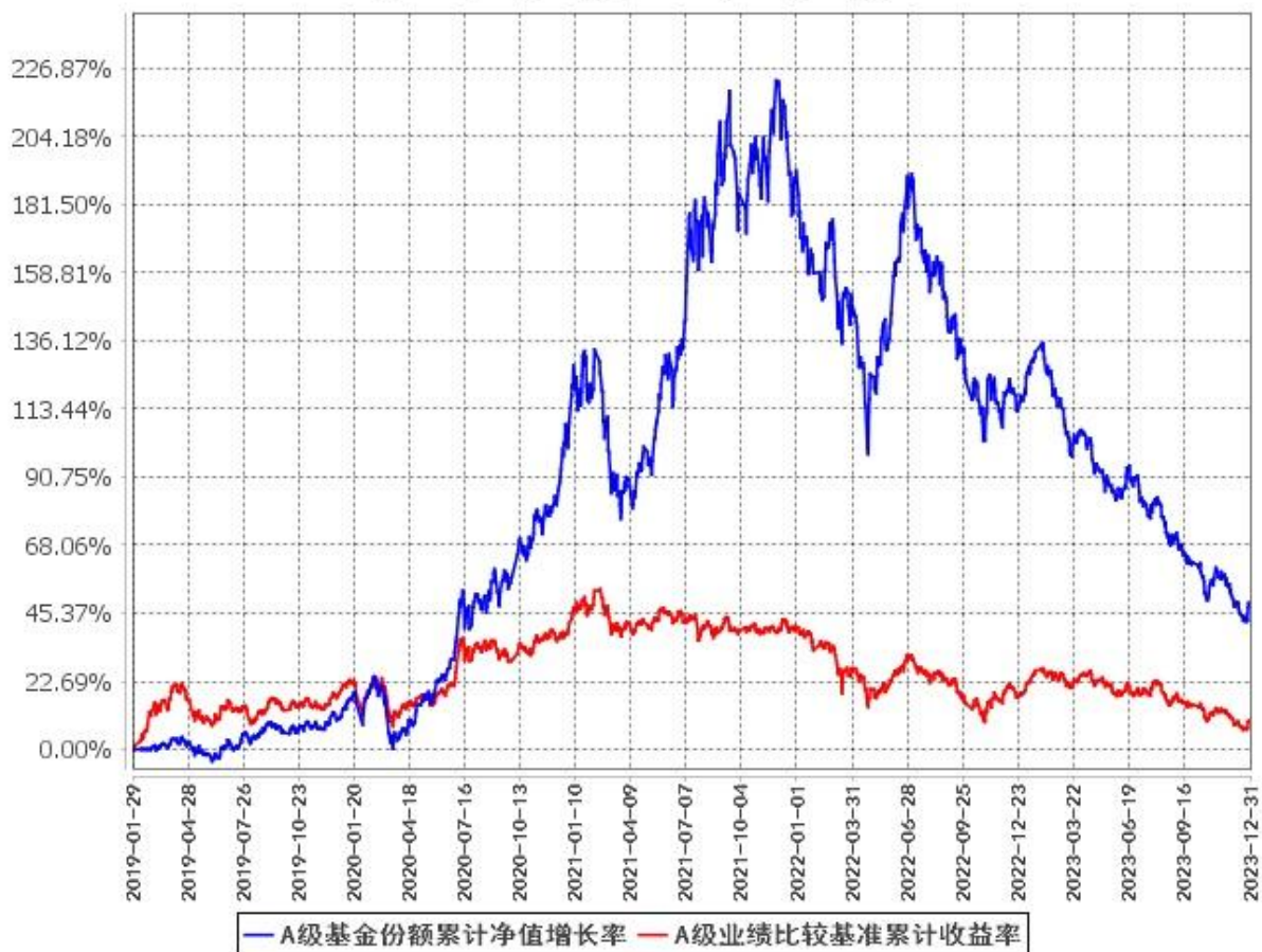
A级基金份额累计净值增长率与同期业绩比较基准收益率的历史走势对比图 (2019年1月29日至2023年12月31日)