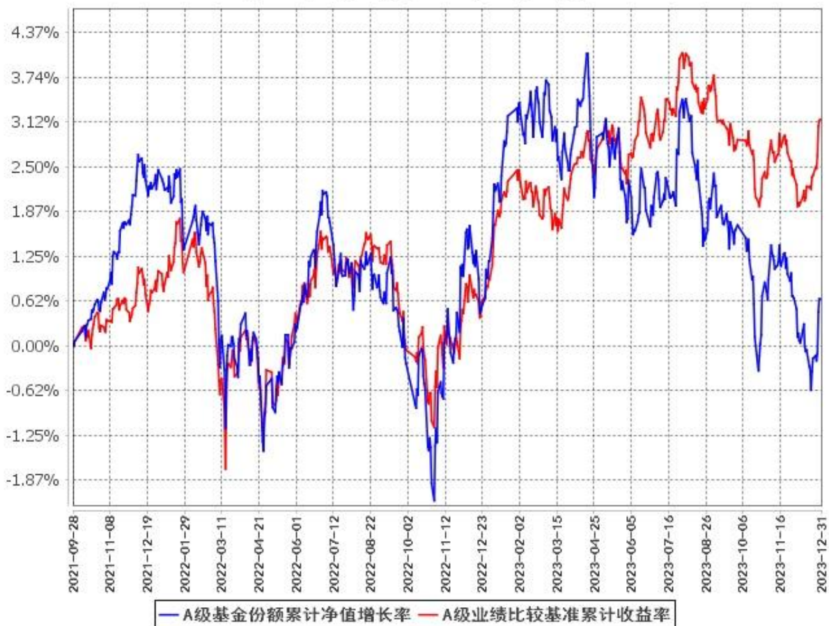
A级基金份额累计净值增长率与同期业绩比较基准收益率的历史走势对比图 (2021年9月28日至2023年12月31日)